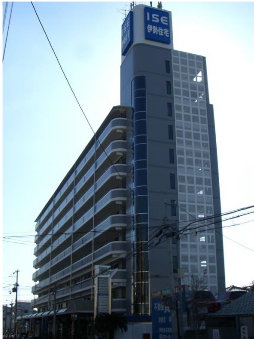
すべてスケルトンです。